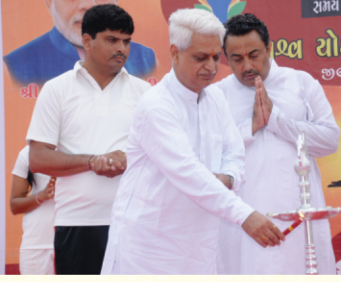
विश्वयोगदिवसस्य उद्घाटनं कुर्वन्तः कुलपतयः