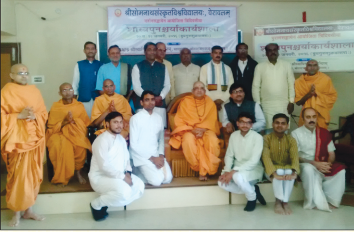
दर्शनपुराणसङ्कायकार्यशालयोः उपस्थिताः प्रतिभागिनः वक्तारश्च

श्रीसोमनाथसंस्कृतविश्वविद्यालयस्य दर्शनसङ्कायः पारम्परिक-शास्त्राणां संरक्षणाय संवर्धनाय अभ्यासाय च २० तः २२ जनवरी २०१६ पर्यन्तं दर्शनसङ्कायस्य सर्वान् विषयान् केन्द्रीकृत्य दिवसत्रयव्यापिनीम् एकां कार्यशालां सारङ्गपुरस्थे B A P S स्वामिनारायणमन्दिरे आयोजितवान्। एतादृश्यां महत्त्वपूर्णकार्य-शालायां विश्वविद्यालयसम्बद्धमहाविद्यालयेषु दर्शनसङ्कायस्य रामानुजवेदान्त-स्वामिनारायणवेदान्त-नव्यन्याय-सर्वदर्शनम् इति विषयाणां विद्वांसोऽध्यापकाः शोधच्छात्राश्च भागमगृह्णन्।