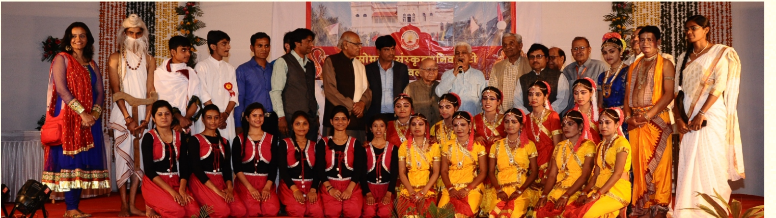
सांस्कृतिककार्यक्रमेषु भागम् ऊढवतां चित्रम्