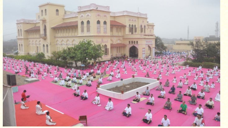
विश्वविद्यालये योगासनं कुर्वन्तः छात्राः अध्यापकाः कर्मचारिणः नागराश्र्व