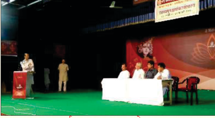
व्याकरणसङ्कायकार्यशालायाः उद्घाटनसत्रे मञ्चस्थाः महानुभावाः

कार्यशालायाः अङ्गतया कृतानां व्याख्यानानां विवरणम् इत्थम् अस्ति -