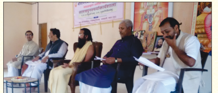
वेदवेदाङ्गसङ्कायकार्यशालायाः उद्घाटनसत्रे मञ्चस्थाः महानुभावाः