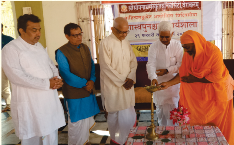
साहित्यसङ्कायकार्यशालायाः उद्घाटनसत्रे समुपस्थिताः महानुभावाः